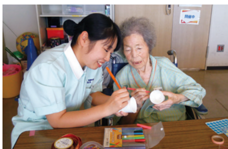
▲院内デイケアの様子