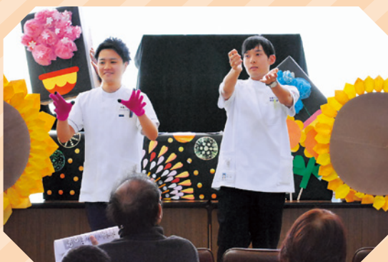
院内デイケアの発表の風景