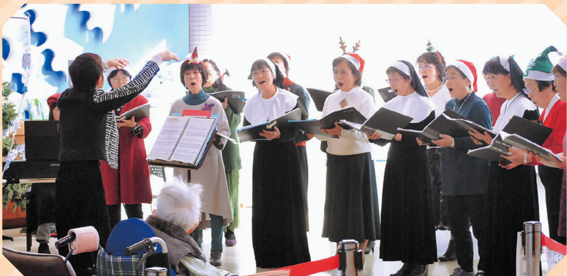
「湖西市民合唱団」によるコンサート風景