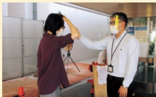
▲検温対応での活用