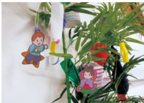
◀◀院内ロビーの様子

例年は、短冊を用意し、願い事を書いて掲示するスペースを設置しておりましたが、感染対策の観点から今年度は休止しました。飾りつけの方法には感染対策のため充分注意しています。