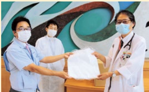
▲寄付をいただいた際の様子

令和2年6月16日に株式会社サンウエルド様のご厚意により、自社製作した医療用ガウンをご提供いただきました。