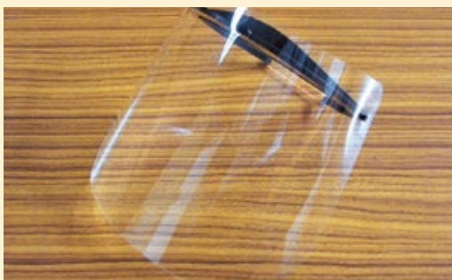
▲いただいたフェイスシールド

令和2年6月22日に本田技研工業株式会社様のご厚意により、自社製作したフェイスシールドをご提供いただきました。