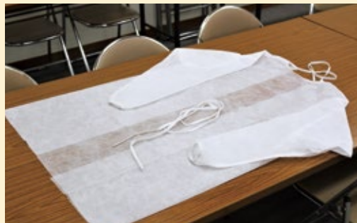
▲いただいた医療用ガウン

令和2年6月22日に本田技研工業株式会社様のご厚意により、自社製作したフェイスシールドをご提供いただきました。